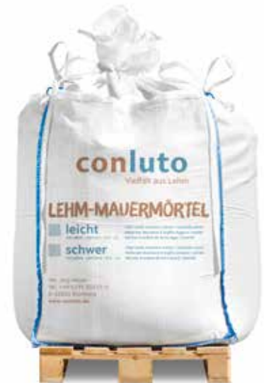
Lehm-Mauermörtel schwer erdfeucht im Big Bag (700 oder 1300 kg)

* Geforderte Werte nach DIN siehe Angaben in Klammern