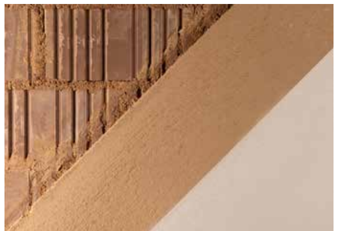
Möglicher Putzaufbau für schwere Lehmsteine profiliert und Oberflächengestaltung

Für die zweite Putzlage sind alle conluto Finishputze und auch der conluto Lehm Flächenspachtel Farbig geeignet.