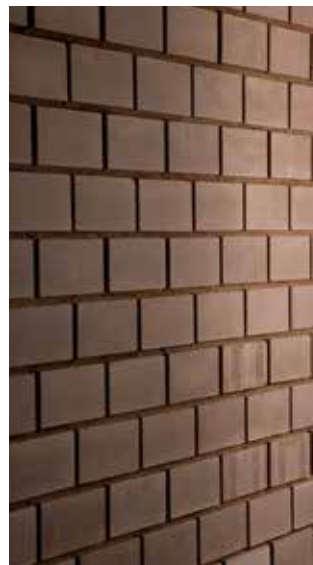
Sichtmauerwerk mit glatten Lehmsteinen

Für Verfestigung und technische Fragen steht Ihnen unser technischer Support zur Verfügung.