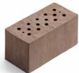
2 DF (06.033) glatt