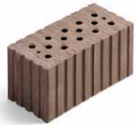
2 DF (06.031) mit Putzrillen

Die Einsparungen an CO 2 -Emissionen bei der Herstellung gegenüber anderen Mauersteinen, die positiven bauphysikalischen Eigenschaften des Baustoffs Lehm und die vollständige Kreislauffähigkeit ermöglichen eine nachhaltige und ressourcenschonende Bauweise.