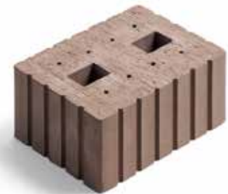
3 DF (06.034) mit Putzrillen