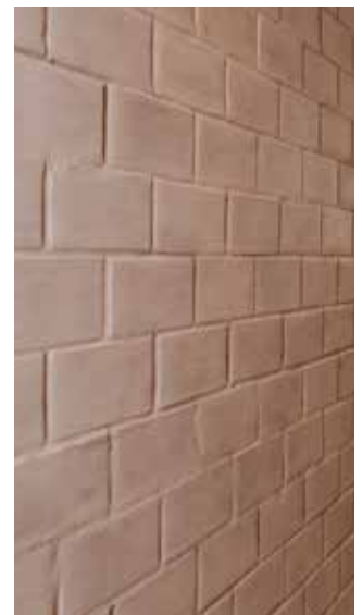
Sichtmauerwerk mit glatten Lehmsteinen, geschlämmt