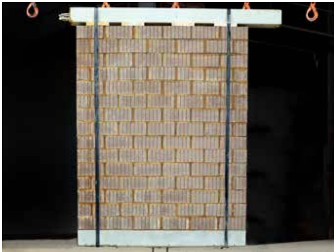
Fertigelement aus Lehmsteinen gerillt

Neben den Lehmsteinen bieten wir auch vorgefertigte Lehmstein-Fertigelemente an. Diese Fertigelemente ermöglichen eine schnelle und kosteneffiziente Montage vor Ort und ersetzen zeitaufwendige Bauarbeiten. Es können sowohl der 2 DF wie auch der 3 DF Lehmstein für die Fertigelemente verwendet werden.